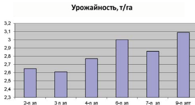
Рис 1. Урожайность озимой пшеницы в зависимости от предшественников (среднее за 2011–2019 гг.), т/га

При пересчете на зерновые единицы выявлено, что наибольший выход зерна наблюдался в 9-польном зернопаротравяном севообороте во все годы исследований (табл. 2). Близок к данному севообороту 4-польный зернопаровой, в котором присутствуют озимые, яровые поздние и яровые ранние культуры. Существенно ниже выход зерновых единиц в 2-польном и 3-польном зернопаровых севооборотах по сравнению